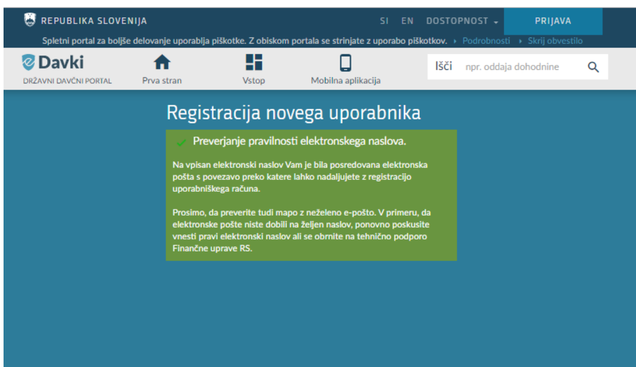
Slika 3: Registracija novega uporabnika